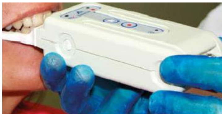
Meting met I-scan door uw tandarts